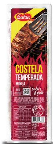
892215 - Costela Minga Temp.