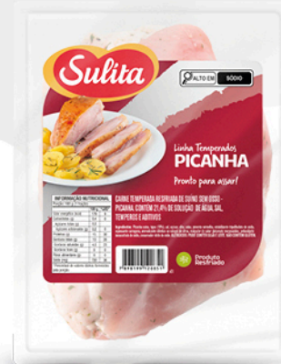
89202 - Picanha Temperada