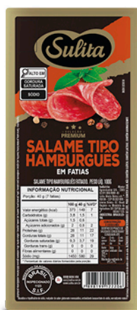
79002 - Salame Tipo Hamburguês em Fatiás