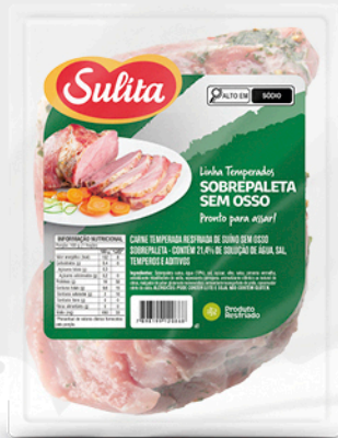
89209 - Sobrepaleta Temperada