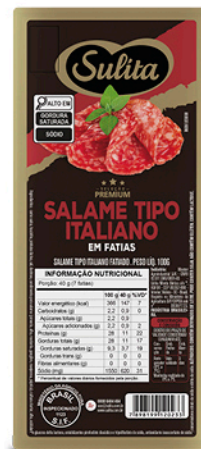
79001 - Salame Tipo Italiano em Fatiás