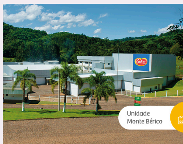
Unidade Monte Bérico