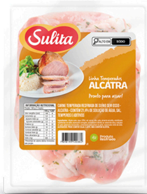
89203 - Alcatra Temperada