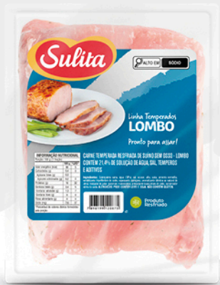
89014 - Lombo Temperado