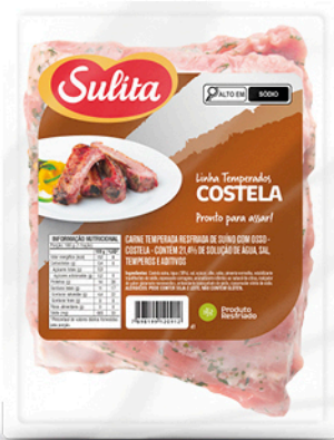
89217 - Costela Temperada