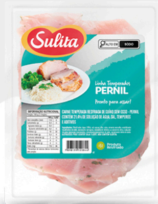
89200 - Pernil Sem Osso Temp.